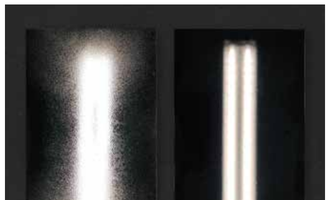
溶剤系プライマー